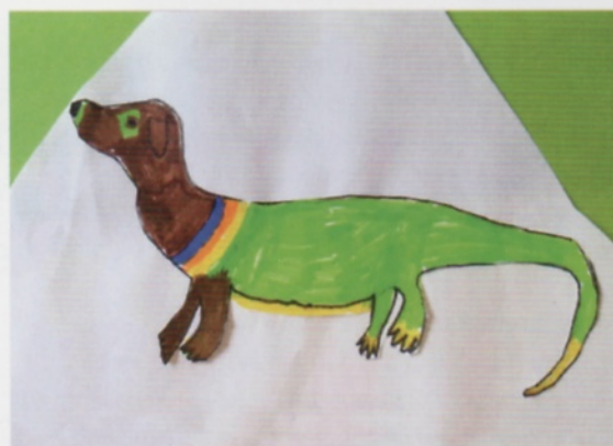
Resultaten van de les 'Romeinse fabels', juf Chantal, groep 5-6.