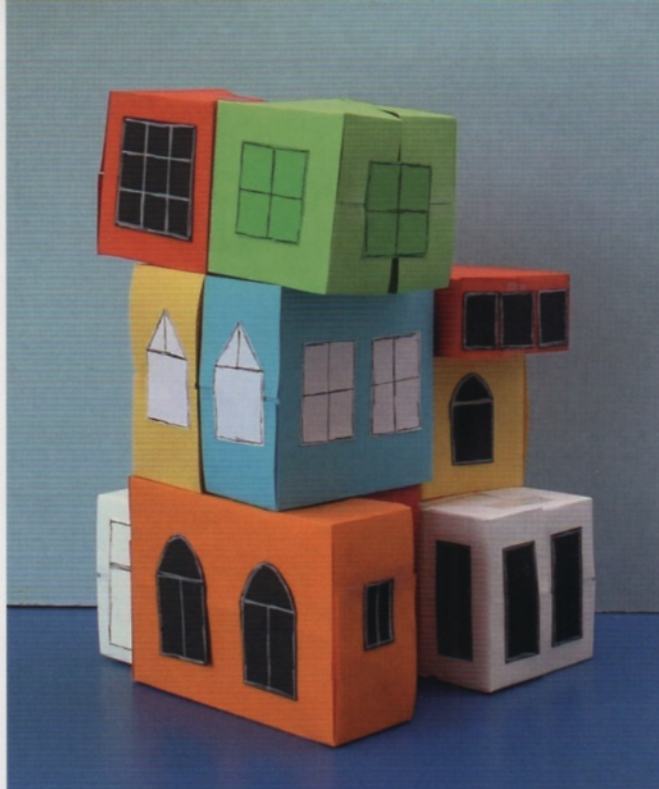
Resultaat van de les 'Mijn huis jouw huis', meester Elwin, groep 1-2

Bootsma, M & Naaijkens, E. (2023). Bijna alles wat je moet weten over thematisch onderwijs. Uitgeverij Pica