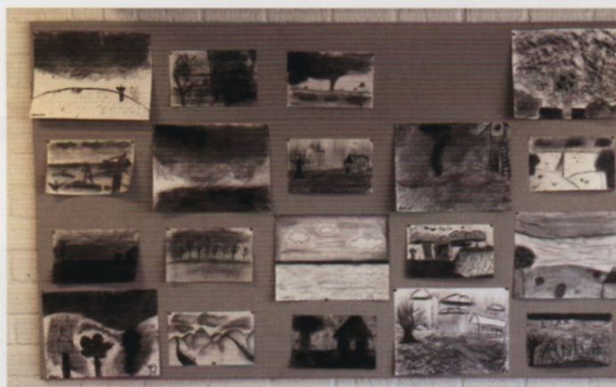
Resultaten van de les 'Er zit een luchtje aan', juf Daphne, groep 8.