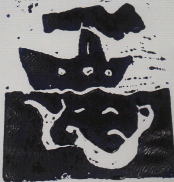
15 juli In een windstille drevén we midden in het ijs. Het was er 110 vadem diep.