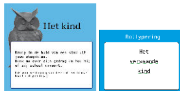
Afbeelding 3. Voorbeeld rolkaart met rolyperingskaart