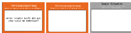
Afbeelding 2. verdiepingvragen en Saai Situatiekaart

Je kunt tijdens het spel ook elke speler een extra lege verdiepingkaart geven. Hij kan deze overhandigen aan de spreker als hij een andere vraag zou willen stellen die niet de verdiepingvraagkaarten staat. Je kunt ook alle spelers uitsluitend lege verdiepingvraagkaarten geven. Aan de hand van de factsheets (afbeelding 4) kunnen ze dan hun eigen vragen formuleren.