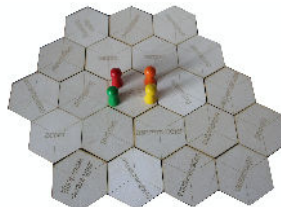
Afbeelding 1. Startopstelling spel

Fotografeer de locaties van je pion en schijf op de speltegels samen met de belangrijkste verdiepingvragen. Elke speler kijkt in alle rust naar het spelbord én bekijkt zijn bezochte posities. Bedenk wat het meest leerzaam is geweest.